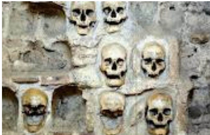
Краеведческий музей “Челе-Кула”