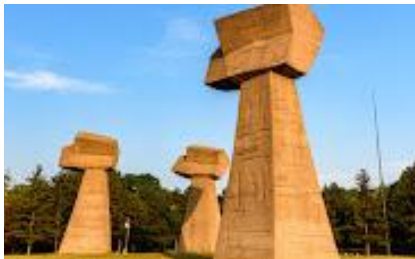
Мемориальный парк “Бубань”