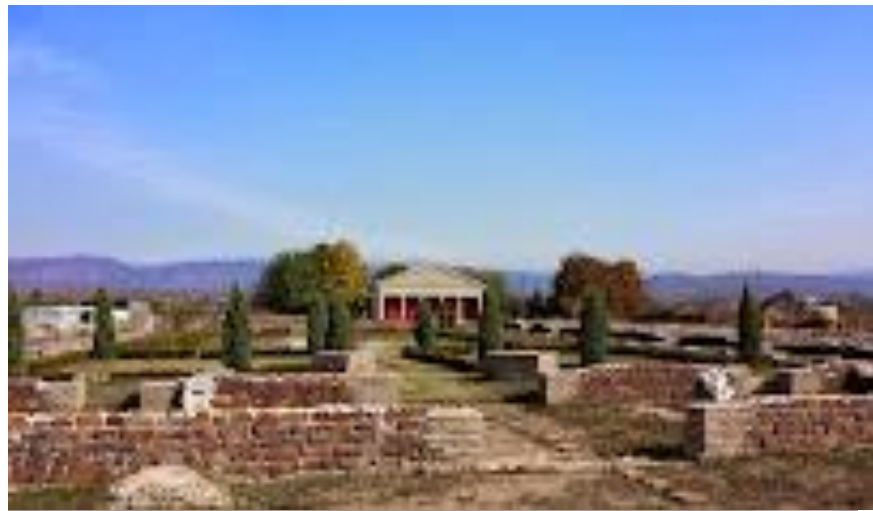
Место археологических раскопок “Медиана”