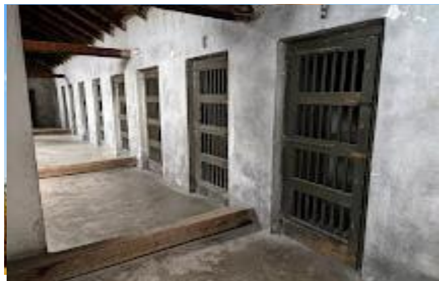
Историческое место Nazi Concentration Camp "Crveni Krst"