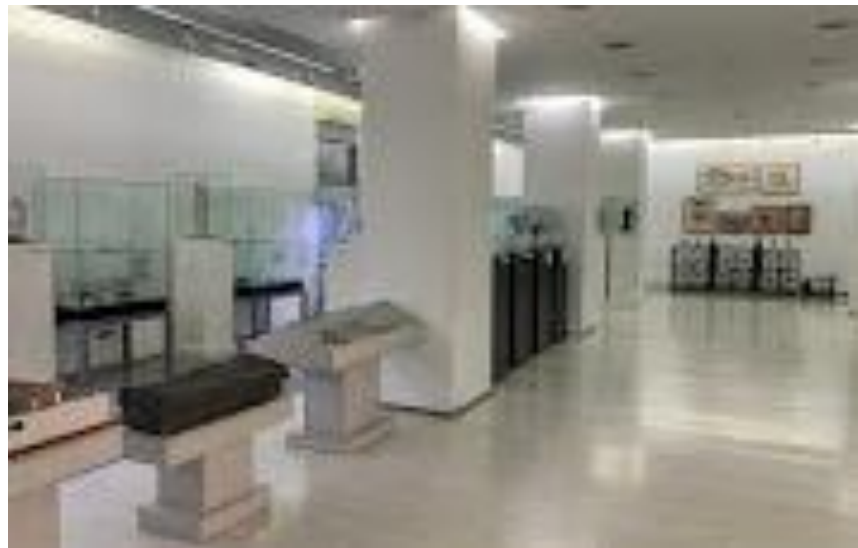
Музей National Museum in Niš